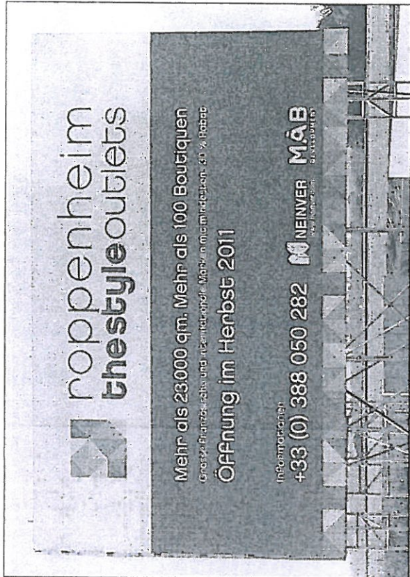
NEUES BAUSCHILD: Nach dem Eigentümerwechsel wird für das Schnäppchenmekka im elsässischen Roppenheim jetzt der Herbst 2011 als Öffnungstermin genannt. Gebaut wird aber immer noch nicht.

Layher-Tochterfirma Neuland GmbH & Co. KG, stikziert gegenüber den BNN die Grundstruktur des bereits vom Sinsheimer Gemeinderat genehmigten Markenmarktas: 10 000 Quadratmeter Verkaufsfläche, 40 bis 60 Shops, rund 40 Millionen Euro Gesamtinvestition. Nach Ansicht Glücks „würde das Sinsheimer Vorhaben durchaus Konkurrenzdruck auf Roppenheim ausüben“. Wenn Sinsheim käme, wäre der städtische Markt „geschlossen“.