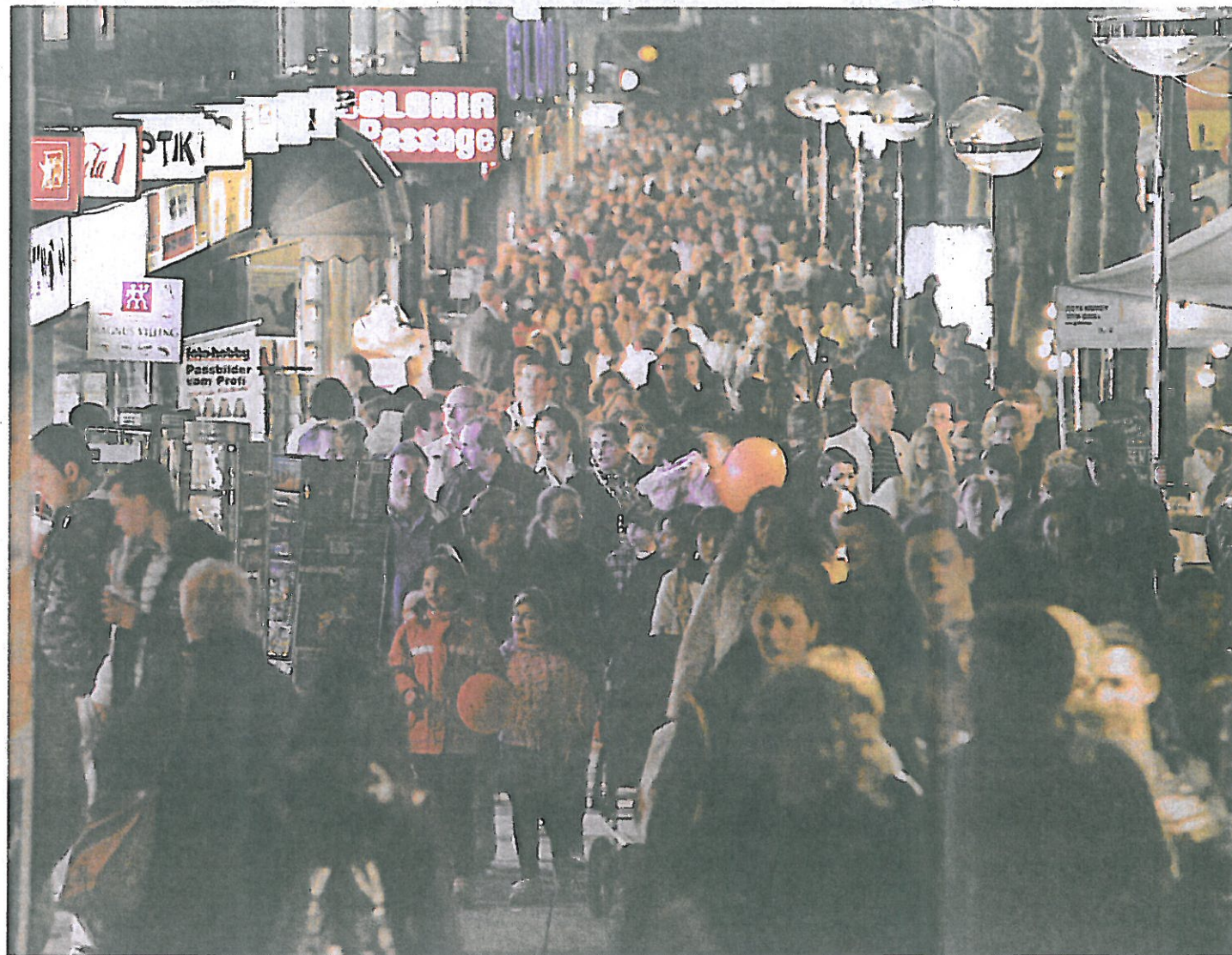
So voll wie bei der jüngsten Einkaufsnacht im April wünscht sich die Cityinitiative die Königstraße jeden Tag.

Die neue Einschätzung von Prognos stützt sich auf mehrere lokale und regionale Wirtschaftsdaten und Fakten. Zum einen werde die Bevölkerung aufgrund der allgemeinen demografischen Entwicklung in den kommenden 15 Jahren voraussichtlich um knapp drei Prozent abnehmen. Zum anderen sei nicht nur wegen der Wirtschaftskrise mit stagnierenden bis sinkenden Umsätzen im Einzelhandel zu rechnen. Diesen beiden Faktoren stehe aber die Tatsache gegenüber, dass Stuttgart mit 1,5 Quadratmetern je Einwohner